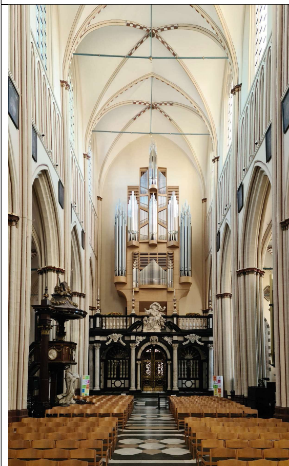
Brügge, Kathedrale Sankt-Donatus Klais 1935/2023, III-P, 56