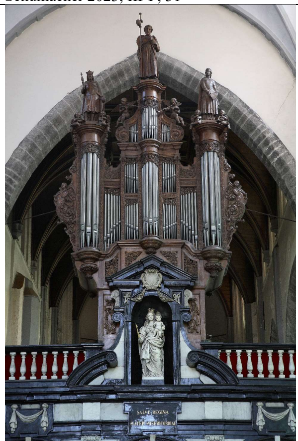
Brügge, Sint-Jacob Louis Hooghuys 1869 / Schumacher 2012, II-P, 23